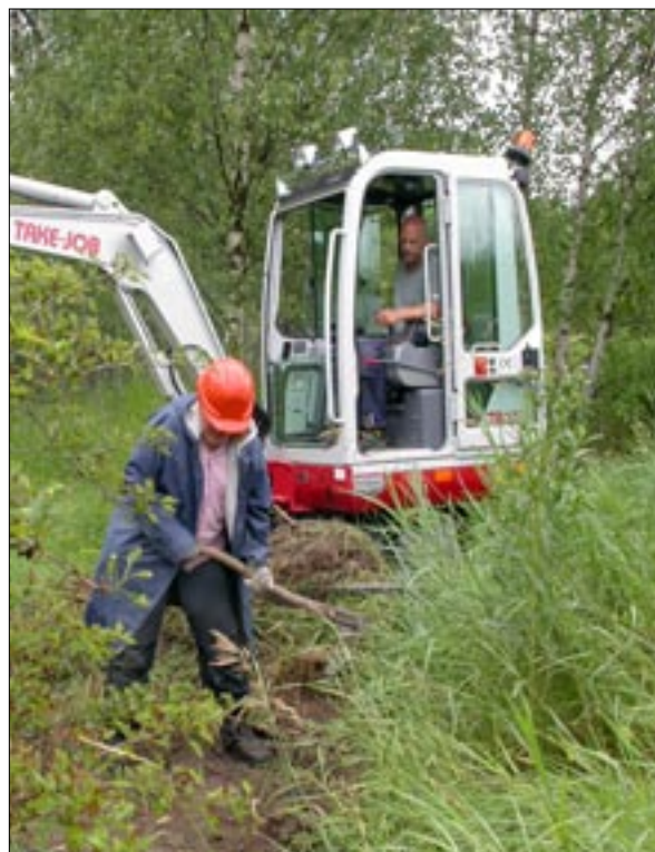
Figur 1. Handgrävning vid schakt M.

I den nordöstra delen av undersökningsområdet lokaliserades äldre schakt med anläggningar och/eller säkra kulturlager för att klarlägga deras status. Schaktningen utfördes med bandmaskin försedd med planskopa. Efter inmätning och dokumentation lades schakten igen. Anläggningarna är täckta med geotextil.