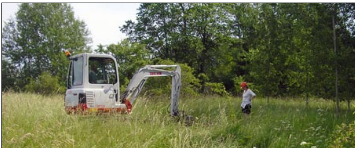
Figur 2. Sökschaktning i den nordöstra delen av undersökningsområdet.

Schakt I mättes in med dålig satellitförbindelse. Denna är förmodligen egentligen placerad över det gamla schaktet närmast åt nordöst. Detta äldre schakt skall också innehålla ett stolphål.