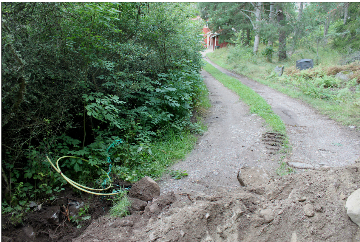
Figur 5. Från en befintlig fastighet hade en fiberkabel grävts ned i ett plogschakt utan arkeologisk närvaro. Ytorna närmast vägen var kraftigt igenväxta. Foto från öst.

kunna kopplas till den nya fiberkabeln. Plogschaktet avvek delvis från mittfåran och ut i vägen, bland annat där kablarna skulle kopplas ihop. Inga fornlämningar bedöms ha störts av schaktningen.