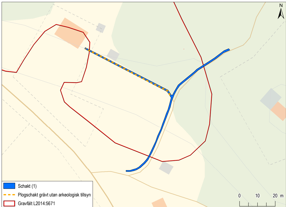
Figur 3. Schakt 1 samt den yta som undersöktes utan arkeologisk närvaro mot bakgrund av Fastighetskartan. Skala 1:1 000.