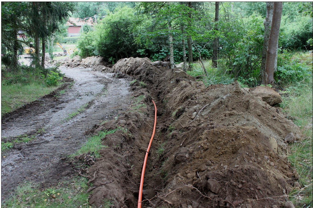
Figur 4. Schakt 1 med nedlagd fiberkabel. Foto från norr