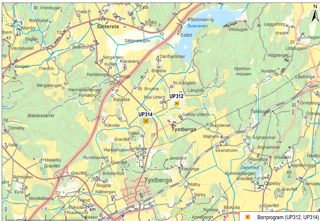
Figur 1. Platsen för den geotekniska undersökningen och den arkeologiska kontrollen i Tystberga. Mot bakgrund av Terrängkartan, skala 1:50 000.