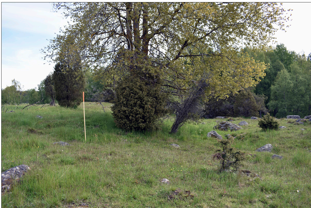
Figur 6. En av de borrh punkter (IC3511) som flyttades ut från en synlig grav. Foto från väster.