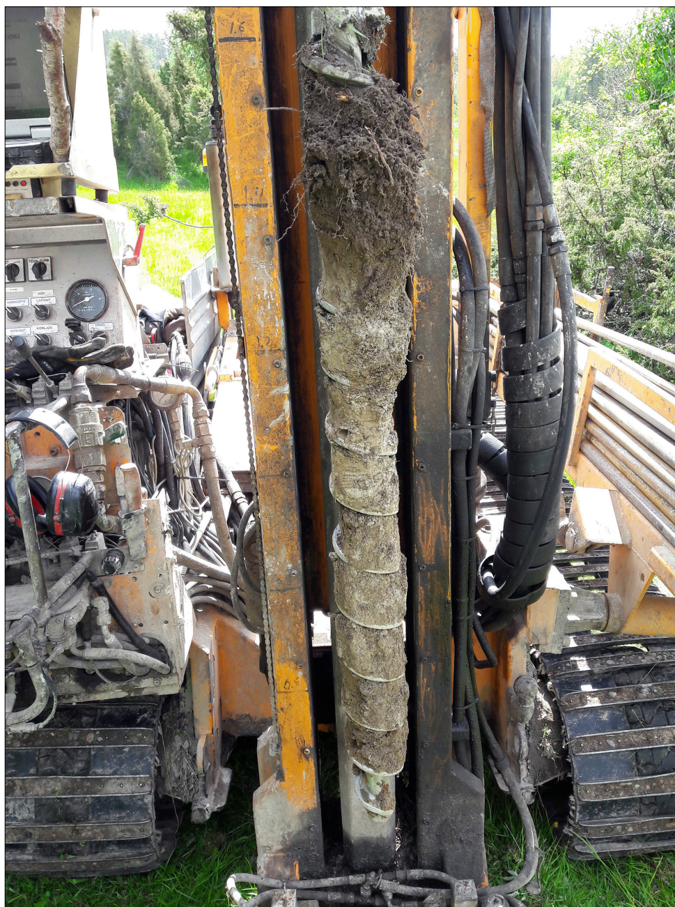
Figur 7. Skruvborr använde som komplement för att fastställa markunderlaget. Foto från väster.

varierad det geologiska underlaget mellan silt och lera samt grus och sand. Borrdjupet ner till fast berg varierade mycket, framför allt inom borrområde UP312, från omkring 2 meter till mer än 10 meter. Inga fornlämningar eller fynd påträffades vid provborringarna. Det uppstod inte heller någon skada på fornlämningar i samband med maskintransporter inom fornlämningsområdet.