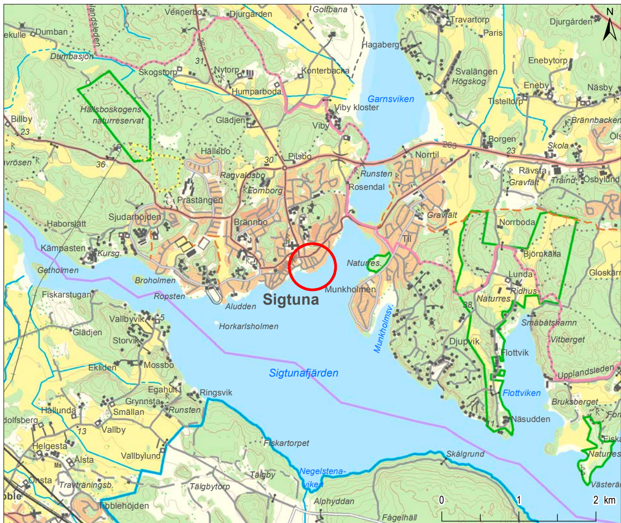
Figur 1. Platsen för den arkeologiska undersökningen i Sigtuna stad. Mot bakgrund av Terrängkartan, skala 1:50 000.