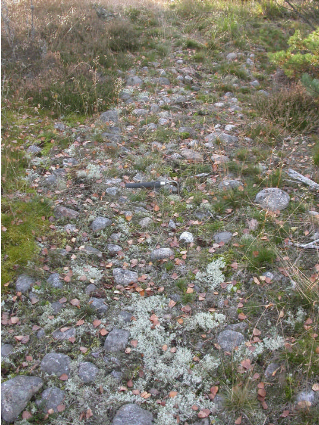
Fig. 5 Röset fotograferat från öster

Trots grävning av 150 provgropar fördelade på tio platser påträffades endast ett enda säkert avslag av kvarts i ett av områdena (se Fig. 6).