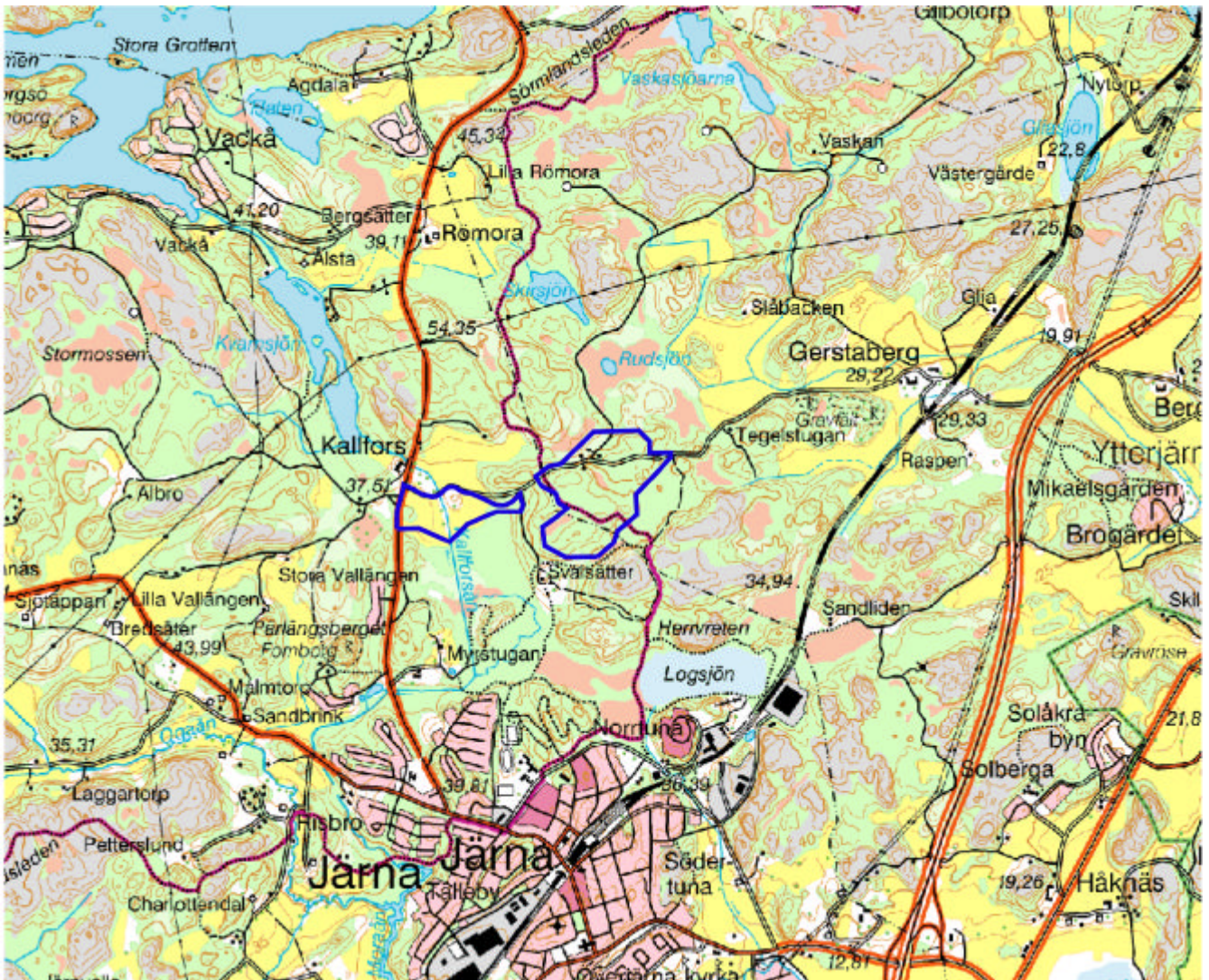
Fig. 1 Utdrag ur topografiska kartan med de två utredningsområdena blåmarkerade.

På uppdrag av Kallfors Gård och i enlighet med beslut från länsstyrelsen i Stockholms län har Arkeologikonsult genomfört en särskild utredning enligt §11 Kulturminneslagen inom centrala och östra Kallfors (del av Kallfors 1:4), Överjärna, Södertälje kommun. Utredningen genomfördes inom två olika delområden, ett västligt beläget i tidigare odlingsmark samt ett större östligt beläget i höglänt skogsmark.