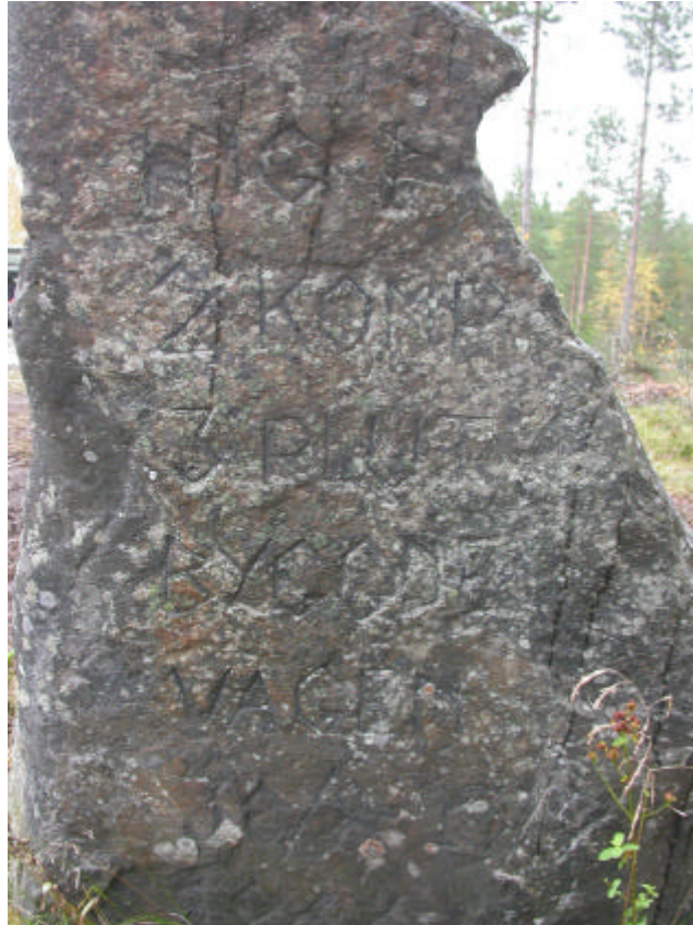
Fig. 3 Minnessten från vägbygge