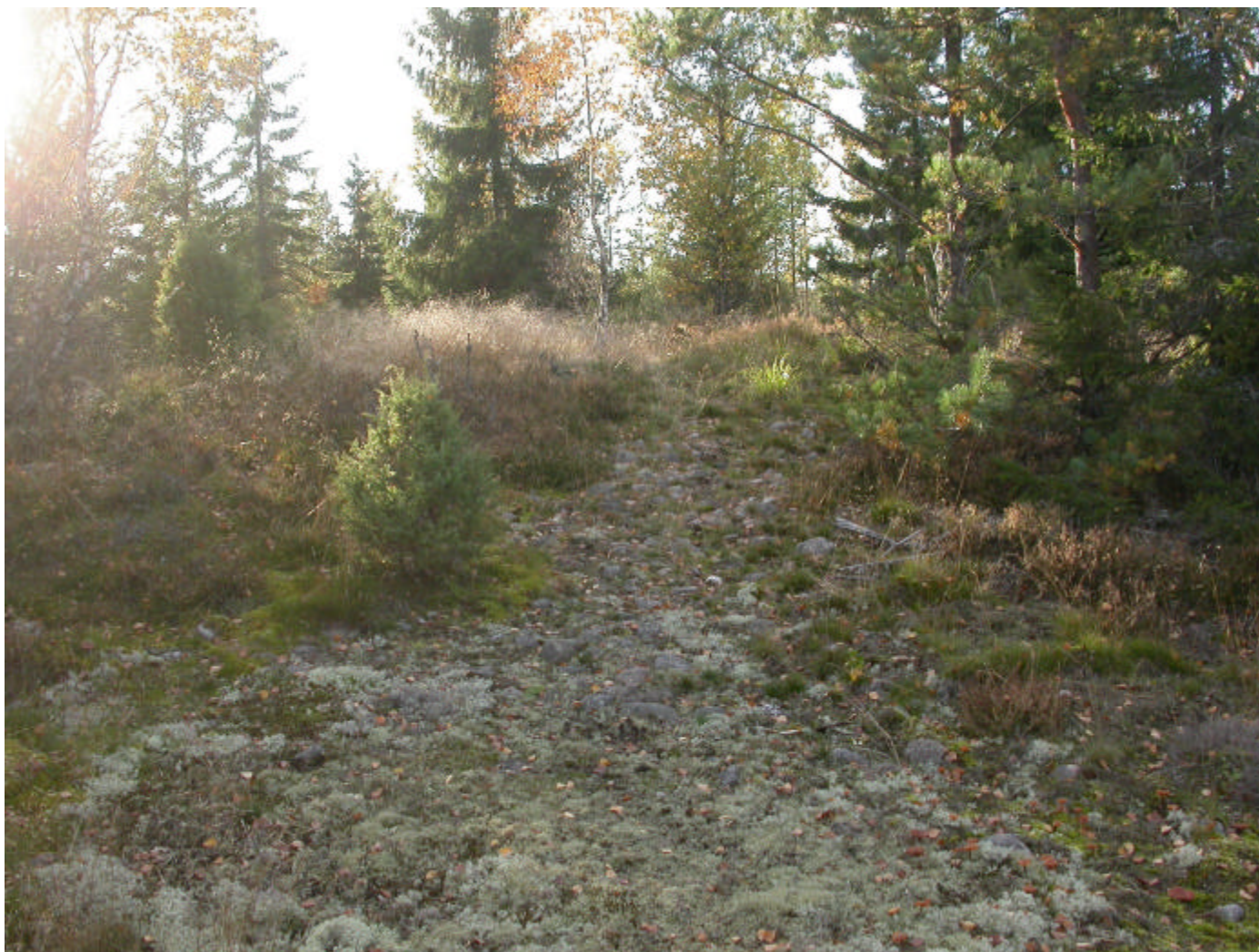
Fig.4 Röset fotograferat från öster