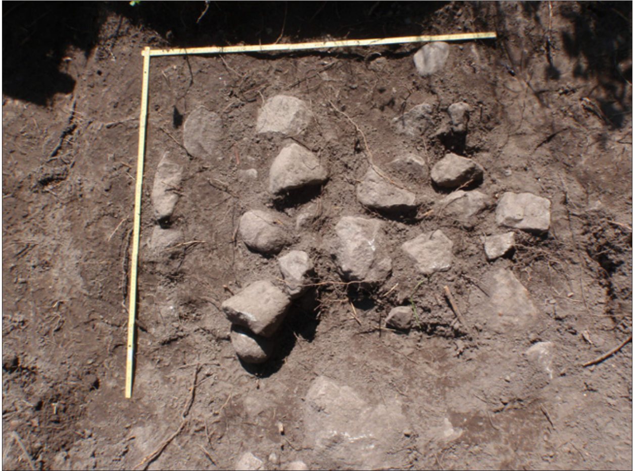
Figur 3. Grav 3.