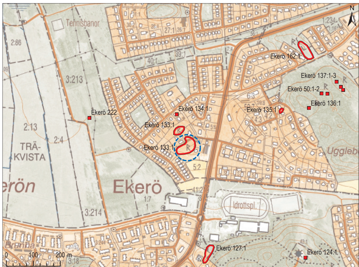
Figur 1. Undersökningsområdet markerat med blått på fastighetskartan. Fornlämningar markerade i rött. Skala 1:8 000.

Syftet med förundersökningen var att avgränsa gravfältet söderut och därmed utgöra underlag för Länsstyrelsens vidare hantering av ärendet.