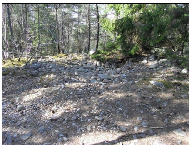
Figur 4. Objekt 16. Det nordliga röset, med plundringsgrop på berget i utredningsområdets sydvästra del.

2 stensträngar som delvis löper parallellt med varandra på ett avstånd av omkring 5 meter återfanns i områdets östra delar (Objekten 12 och 13). Dessa löper i sydväst-nordostlig riktning och av riktningen att döma förefaller de leda från produktionsjordarna som tidigare fanns öster om utredningsområdet in i det utmarksområde som är föremål för denna utredning (figur 6 och 7).