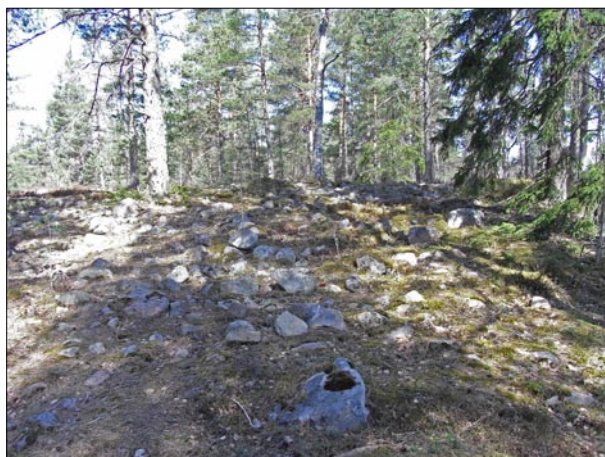
Figur 3. Objekt 4, det centrala och största röset i en grupp av fem på ett berg i utredningsområdets östra del.

Rösenas belägenhet på höjder i det som var skogsmark under bronsålder är typiskt. Placeringen menas spegla en begynnande territorialitet där monumenten tros ha avgränsat olika bygder ifrån varandra (Thedéen 2004). De bosättningar gravarna i sådana fall tillhör ligger lägre i landskapet, på moränmarker som gränsar mot lerjordarna. Av de historiska kartorna framgår att lägen för boplatser av ett sådant slag möjligen kan ha legat öster om utredningsområdet där villabebyggelsen i Ellapark i dag breder ut sig. Alternativt åt Norr i Hagbys öppna åkerlandskap.