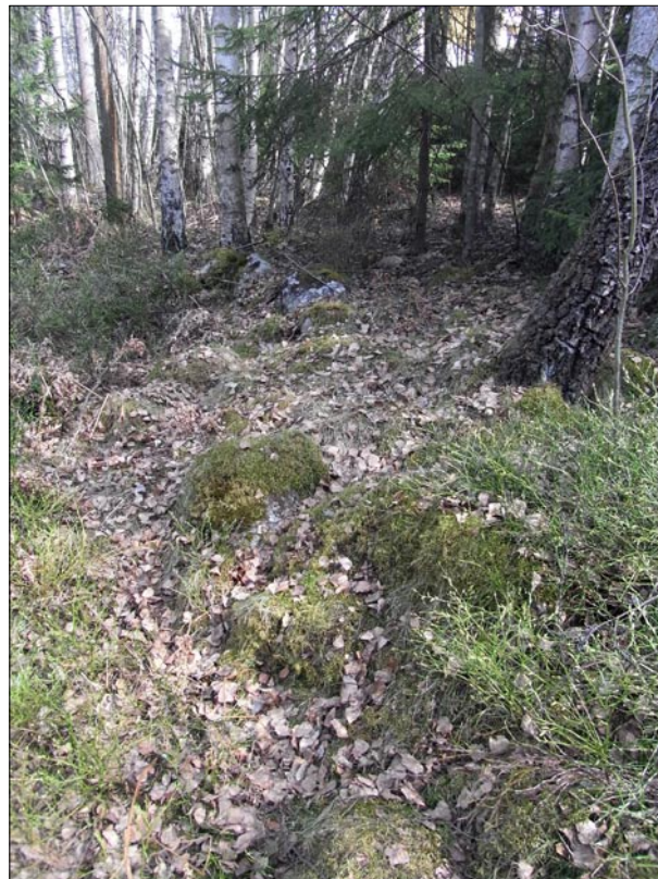
Figur 7. Objekt 13. Den mossbevuxna sydöstra stensträngen.

Objekt 19, är däremot utsatt på häradskartan från 1901-06 och är således äldre. Vid en granskning av en ägomätningsskarta över Ella från 1715 återfinns den däremot inte markerad utan är sannolikt yngre än så.