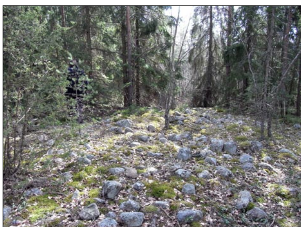
Figur 5. Objekt 17. Det sydliga röset på berget i utredningsområdets sydvästra del.

Sju lägen där det är möjligt att stenåldersboplatser kan finnas hittades i området. Dessa lägen finns i dess södra och östra delar. För att konstatera om det finns fornlämnningar på dessa ytor krävs det att länsstyrelsen beslutar om en arkeologisk utredning etapp 2. Lägena där potentiella stenåldersboplatser kan finnas är inte avgränsade och om det i verkligheten finns boplatser på de markerade platserna kan dessa både vara större eller mindre än de utpekade ytorna.