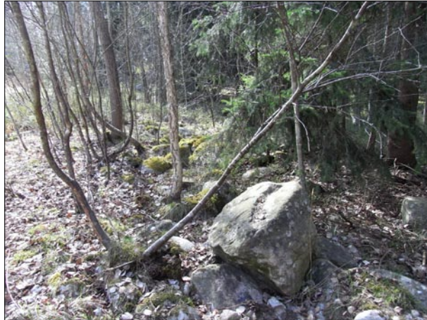
Figur 6. Objekt 12. Den nordvästra stensträngen.

De övriga objekten består av olika kulturhistoriska lämningar och utgörs av en mindre stentäkt i områdets sydöstra del samt två bebyggelsegrunder från historisk tid och en jordkällare som tillhör den ena bebyggelsegrunden (objekt 9, 14, 19, 20). Stentäkten (9) består av sprängsten, inga borrhål iaktogs dock i stenarna.